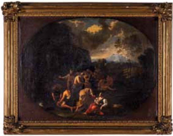
34 Pittore del XVII secolo Due dipinti di scene bibliche: Il viaggio di Abramo, Mosè fa scaturire l'acqua dalla roccia. Olio su tela. cm 70x93 € 1.500 / 2.000