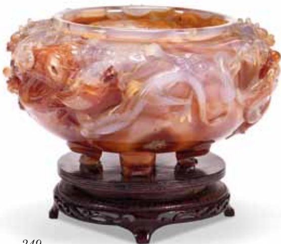
249 Coppa in Corniola scolpita a tutto tondo ad animali fantastici, all'interno con un drago. Epoca XIX-XX secolo. cm 17x31 € 1.500 / 2.500