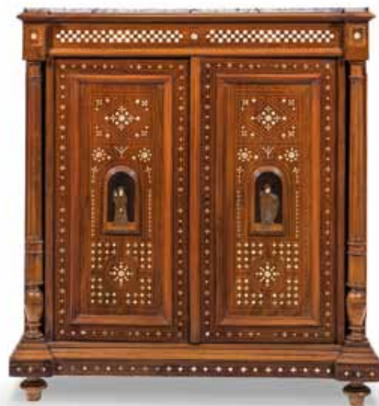
82 Credenza a due ante con intarsi certosini. XIX-XX secolo. cm 122x112x44 € 1.000 / 1.200