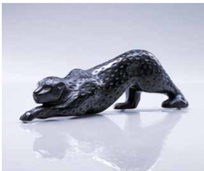
265 Lalique Scultura in vetro nero raffigurante una pantera. cm 10,5x37x6,5 € 500 / 600