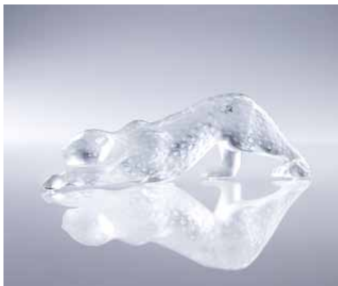
264 Lalique Scultura in vetro trasparente raffigurante una pantera. cm 10,5x37x6,5 € 500 / 600