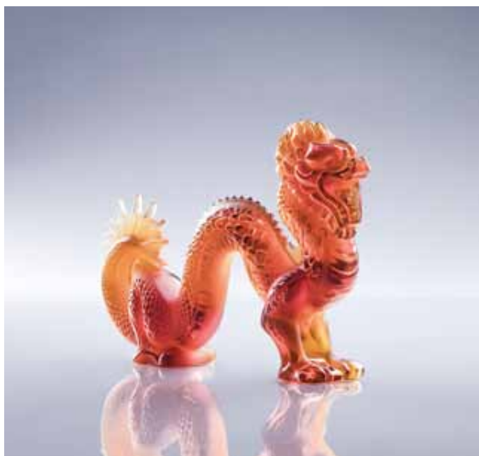
263 Lalique Scultura in vetro rosso raffigurante un drago. cm 19x26,5x5 € 500 / 600