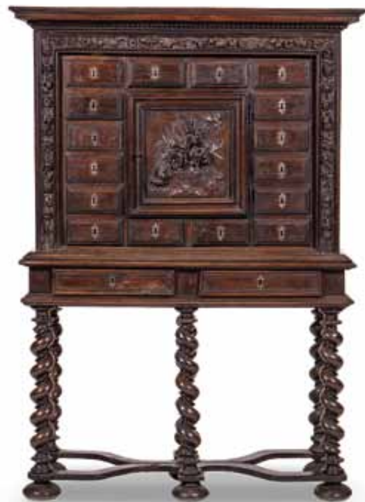
81 Stipo in noce, fronte con cassetti entro cornice scolpita a fiori e foglie. Base a colonne tortili. XVII secolo. cm 181x121x48 € 1.300 / 1.800