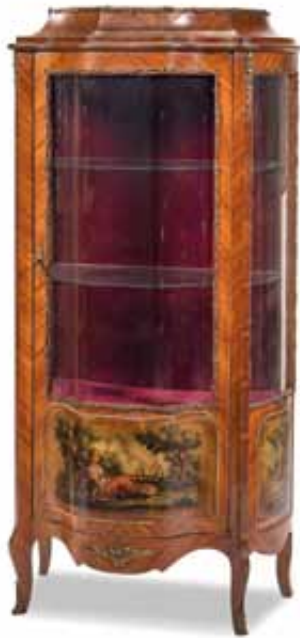
79 Vetrina di forma mossa impiallacciata in legno di rosa e decorata con bronzi. Epoca fine del XX secolo. cm 180x78x38 € 500 / 700