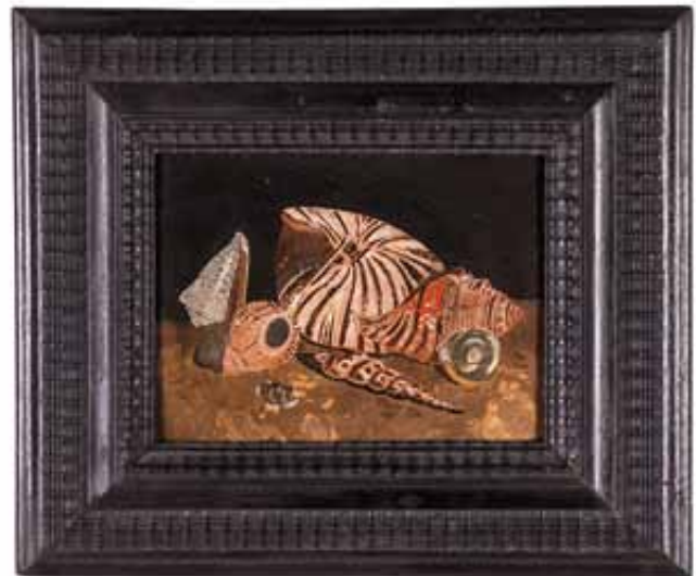
35 Commesso di scagliola su ardesia, con raffigurazione di conchiglie. Cornice in legno ebanizzato. Firenze, XVIII secolo cm 18,5x24 € 1.000 / 1.200