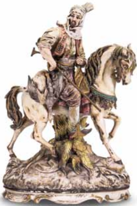
183 Arabo a cavallo in biscuit policromo. Epoca, XX secolo. h cm 66 € 500 / 700