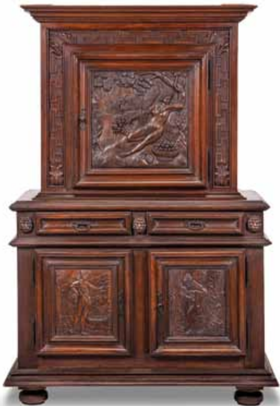
83 Credenza a due corpi in noce scolpito con allegorie e due cassetti nella parte inferiore. Epoca XVIII secolo. cm 195x130x65 € 1.000 / 1.300