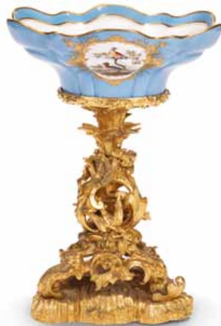
184 Centro tavola in bronzo cesellato e dorato, con soprastante coppa in porcellana dipinta a fiori in policromia. XIX secolo. cm 38x30 € 500 / 600