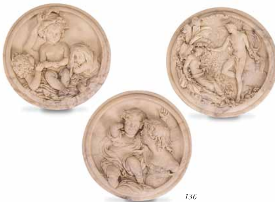
136 Tre medaglioni in marmo raffiguranti scene mitologiche e putti. Uno dei tre reca la firma sul fondo E.W.Wyon. diam. cm 18,5 € 500 / 800