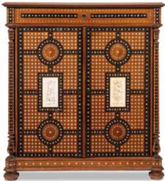
80 Credenza in noce, decorazione certosina in osso, piano e porte centrate da scene religiose. XIX-XX secolo. cm 129x117x56 € 1.000 / 1.200