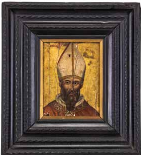
36 Scuola Cretese del XVII secolo. Ritratto di Vescovo. Olio su tavola € 500 / 600