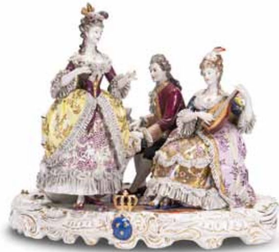
182 Gruppo in porcellana raffigurante un concerto. Manifattura di Berlino, XX secolo. cm 47 x 55 x 40 € 500 / 800