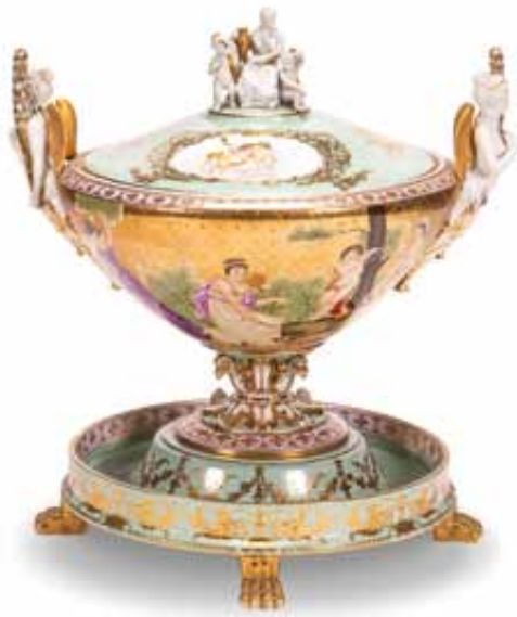
181 Grande zuppiera in porcellana a fondo verde dipinta in policromia. Epoca XX secolo. cm 50x41 € 500 / 700